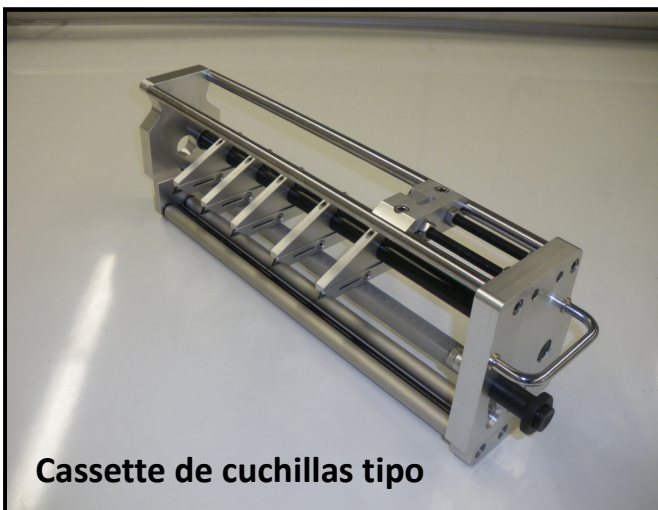
Cassette de cuchillas tipo