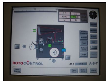
Control mediante Pantalla táctil