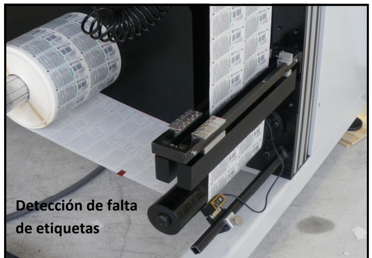
Detección de falta de etiquetas